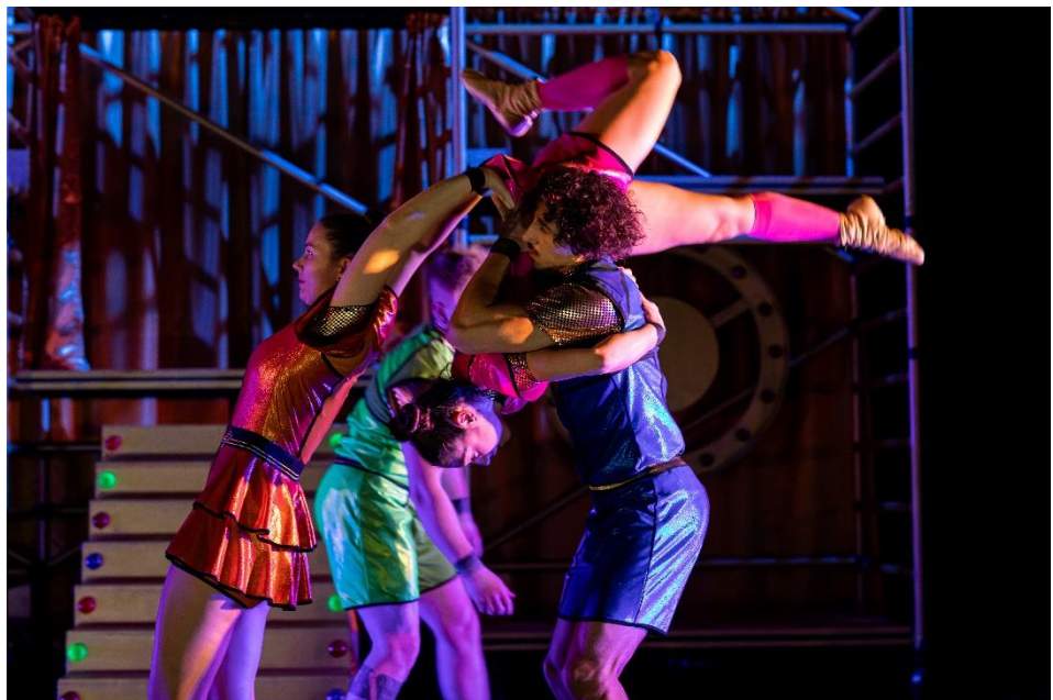
De vier acrobaten.

Geen foto's of video's maken alsjeblieft, dit kan gevaarlijk zijn voor de acrobaten!