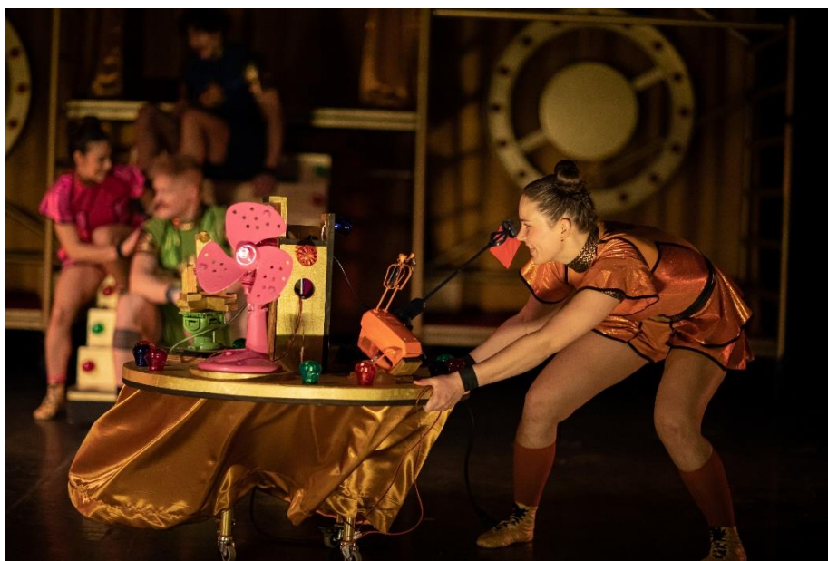
In protest tegen de machine die de opdrachten geeft.

De vragen gaan door op de volgende bladzijde! →